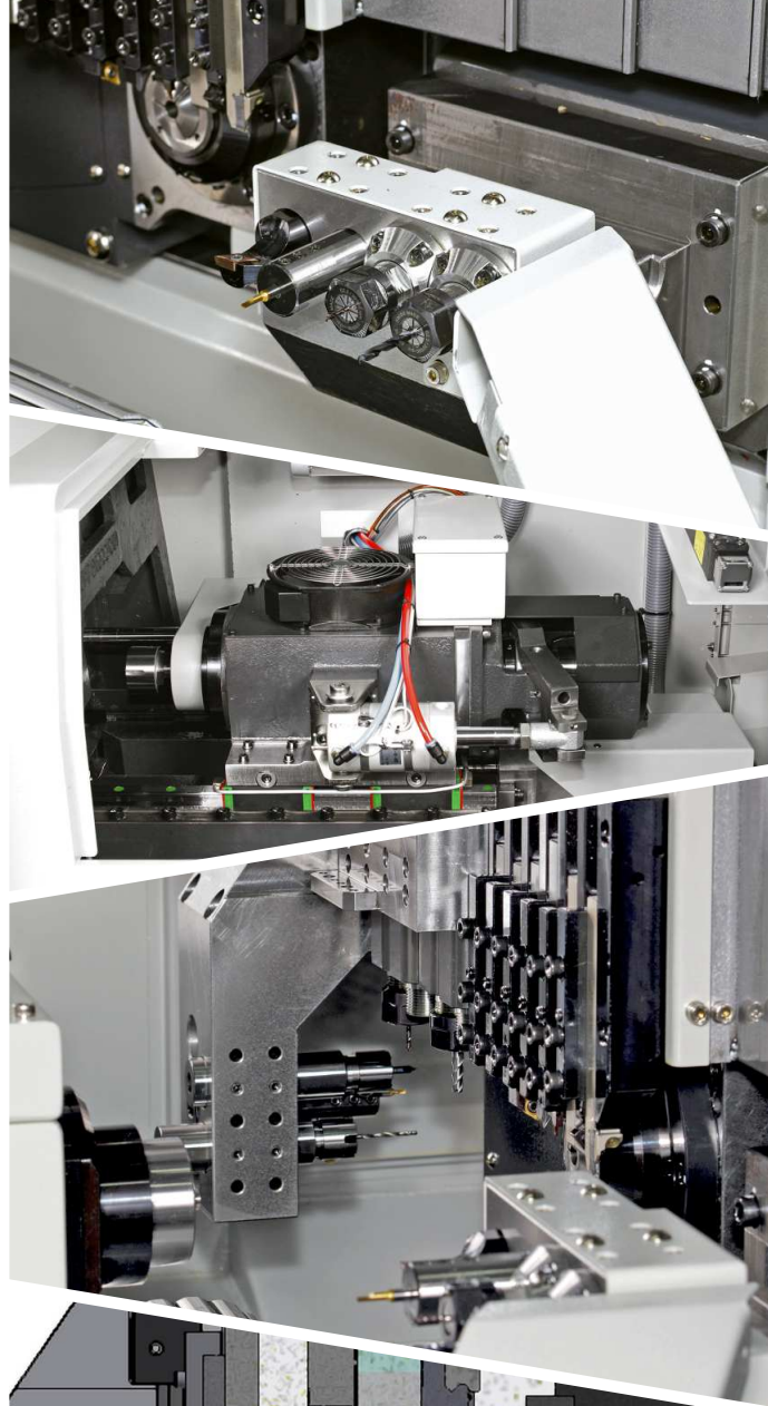
Trasmissione bussola girevole